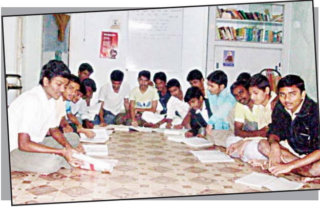
మధురానగర్లోని వృషమణి ఫౌండేషన్లో ఆశ్రయం పొందుతున్న విద్యార్థులు